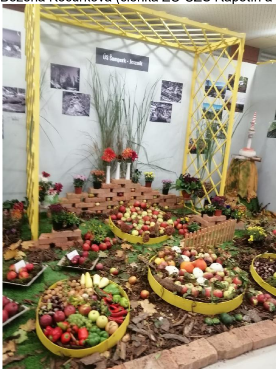
Pohled na stánek ÚS ŠUMPERK – JESENÍK