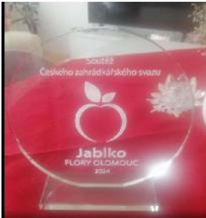
Ocenění za 1. místo Jablko Flory Olomouc 2024- odrůda Rubinola