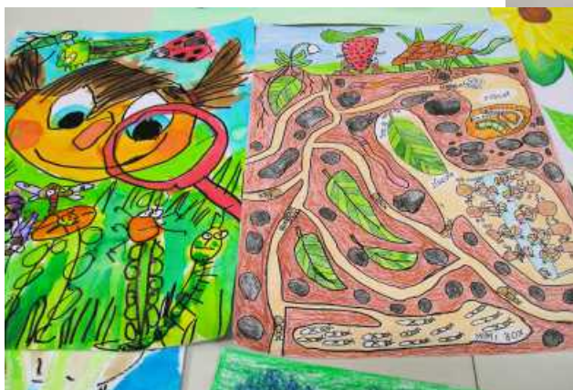
Nejlepší soutěžící postoupili do celostátního kola

Protože se letos kvůli koronavirové situaci nemohla uspořádat tradiční okresní výstava, nejlepší práce byly vystaveny za okny budovy ÚS ČZS v Prostějově. Věříme, že potěšily kolemjdoucí a zpříjemnily jim procházku. Pro autory jsou připravené diplomy a drobné odměny. Dále byly práce odeslané do celostátního kola na Ústředí ČZS do Prahy.