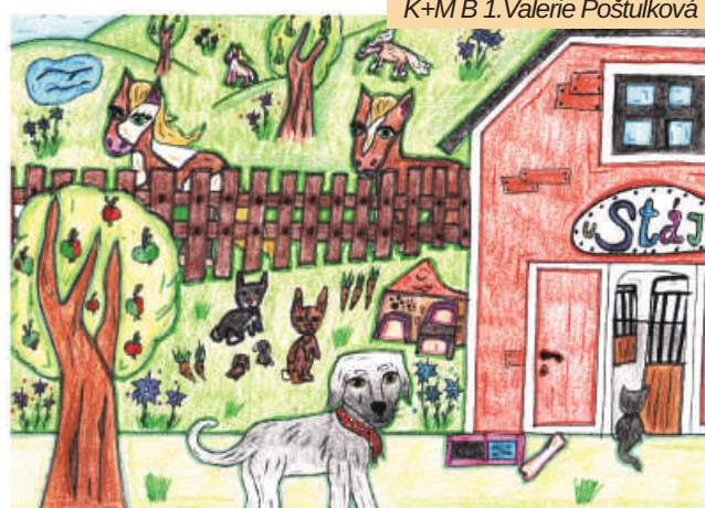
K+M B 1. Valerie Poštulková

Dorazilo i mnoho keramických prací a souborů, jedno obzvláště podařené dílo má úctyhodný průměr téměř 50 cm a je doplněno mnoha drobnými doplňky. Jeho zhotovení muselo být značně náročné a zaslouží si náš obdiv.