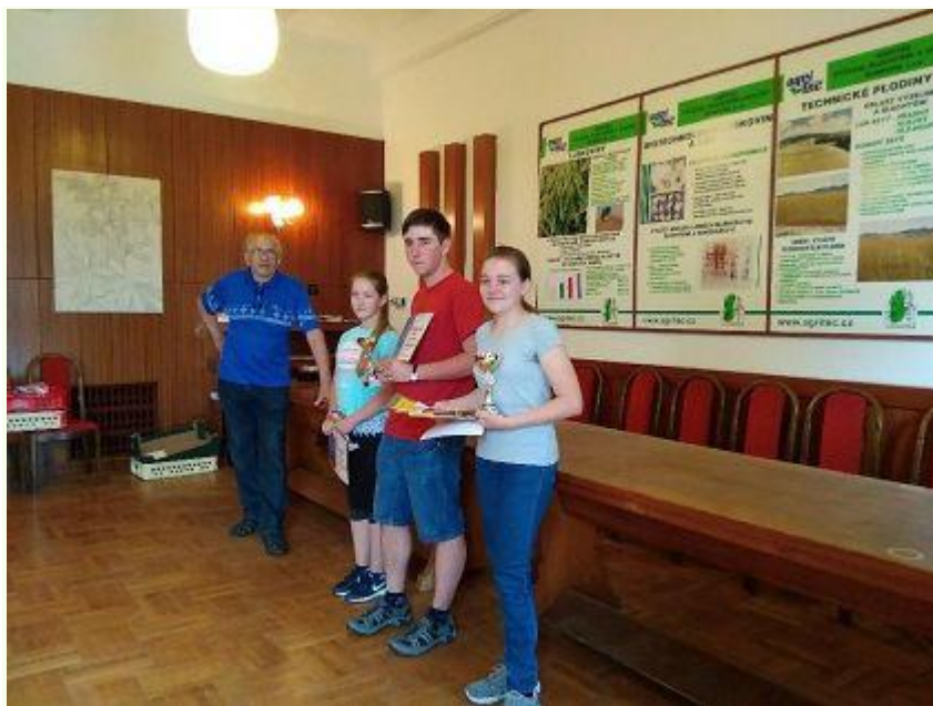
Okresní soutěž „Mladý zahrádkář“, Územní sdružení ČZS Šumperk-Jeseník

Dne 11.5. 2018 uspořádalo Územní sdružení Českého zahrádkářského svazu Šumperk – Jeseník okresní kolo soutěže „Mladý zahrádkář“. V letošním roce se do soutěže přihlásily tři školy - III. ZŠ Zábřeh, ZŠ Bludov a I. ZŠ Šumperk. Soutěžilo se ve dvou kategoriích. Mladší žáci 4.-6. třída ZŠ, starší žáci 7.-9. třída ZŠ. Soutěž se skládala ze dvou částí. Písemného testu, kde žáci vybírali ze 4 odpovědí tu správnou / celkem 40 otázek/, druhá část se skládala z poznávání semen a rostlinného materiálu.