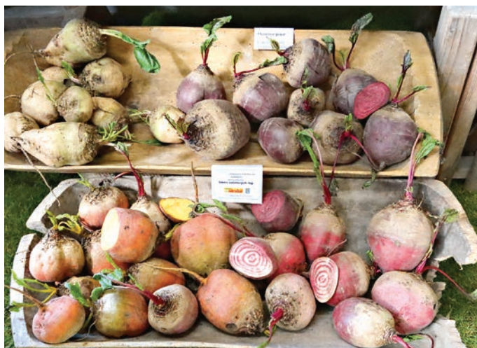
Směs salátových řep získala cenu šéfredaktora časopisu Zahrádkář.