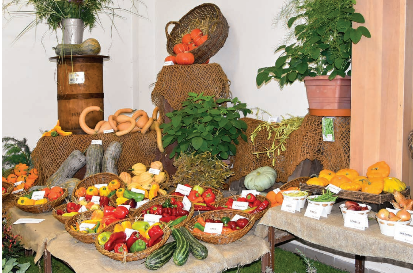
Jedno ze zákoutí pavilonu G