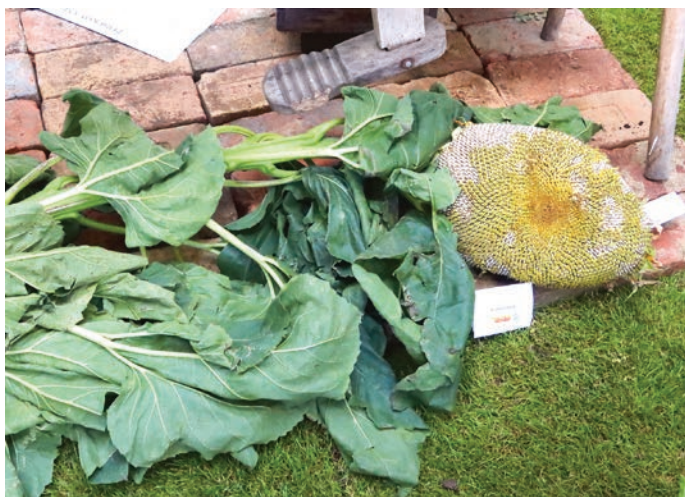
Obří slunečnice z Kyjova