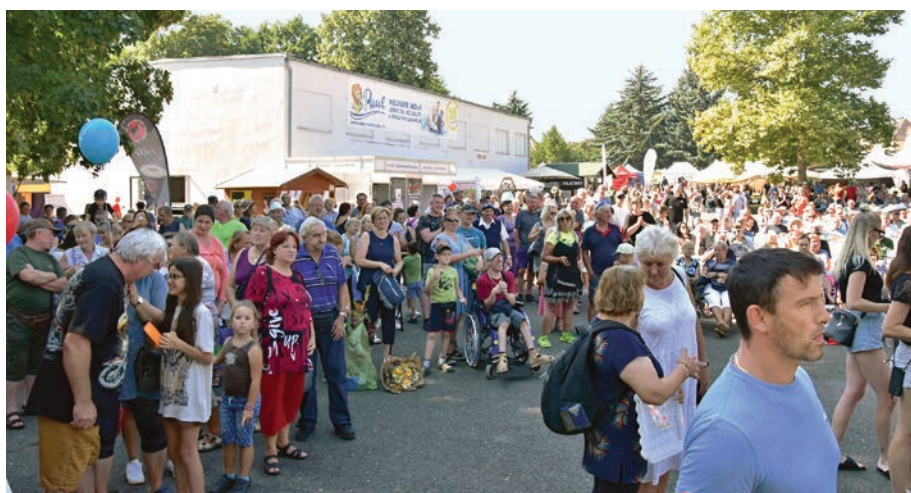
Zájem o dění na pódiu byl značný.